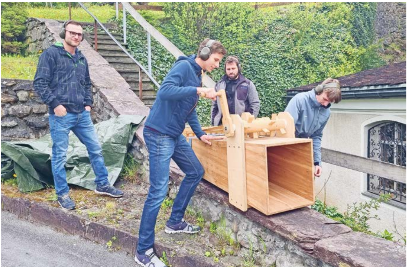
In Vilters wird "gerätscht" jeweils am Karfreitag und zum Beginn der Osternacht. Auf dem Foto ein Teil des Rätscherteams in Aktion.