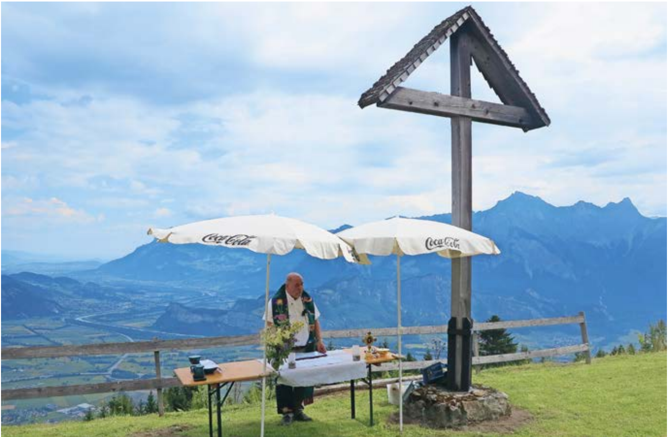
Alpmesse im Juli auf Alp Wald (Untersäss) Der Gottesdienst in der Natur wurde trotz des zuerst regnerischen Wetters gut besucht.