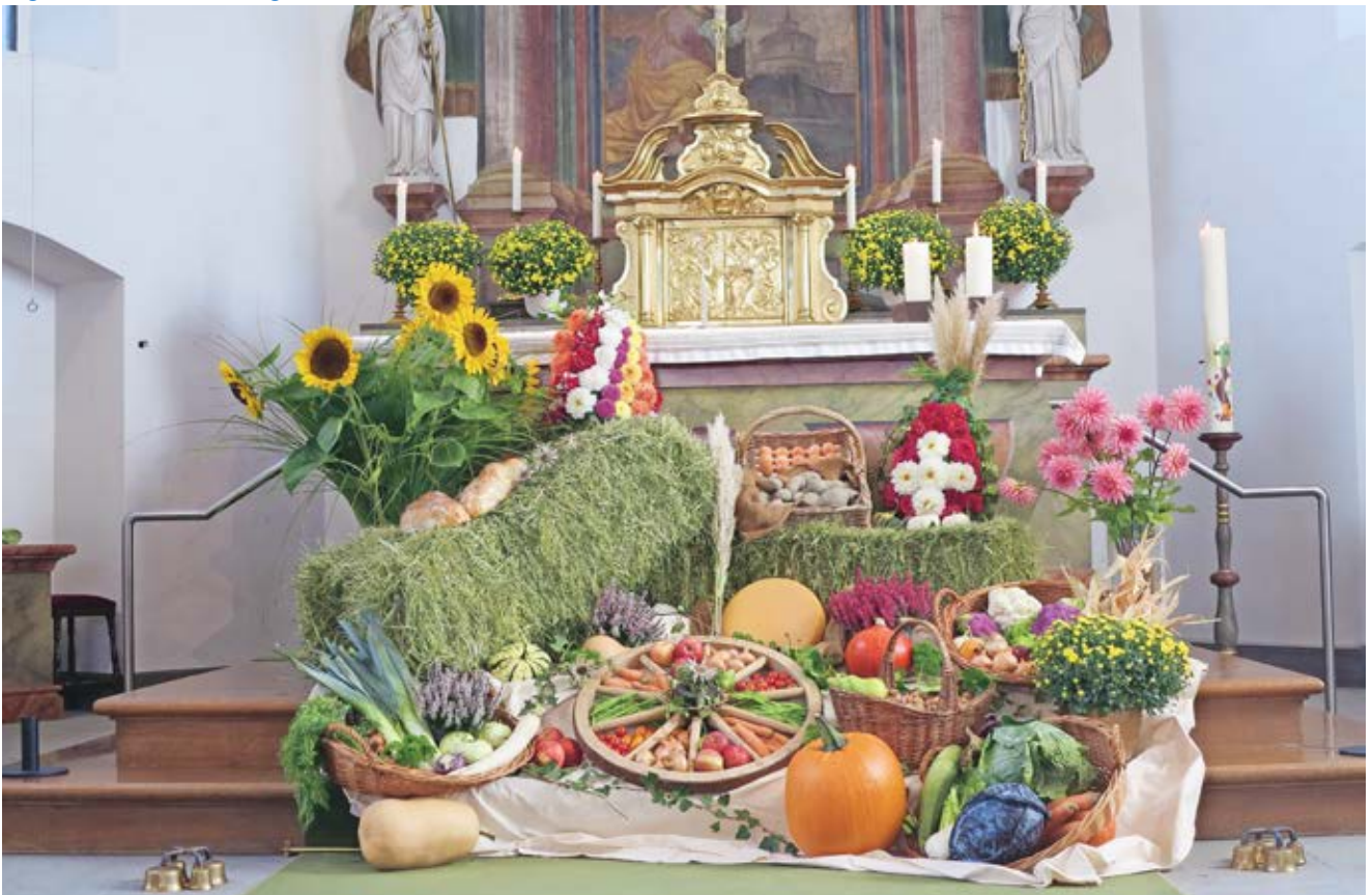
Die Bäuerinnen und Landfrauen von Vilters-Wangs dekorierten die Kirche zum Erntedankfest mit Minilagerstark im September. Die Apéroplatten im Pfarreiheim wurden ebenfalls von ihnen zusammengestellt.