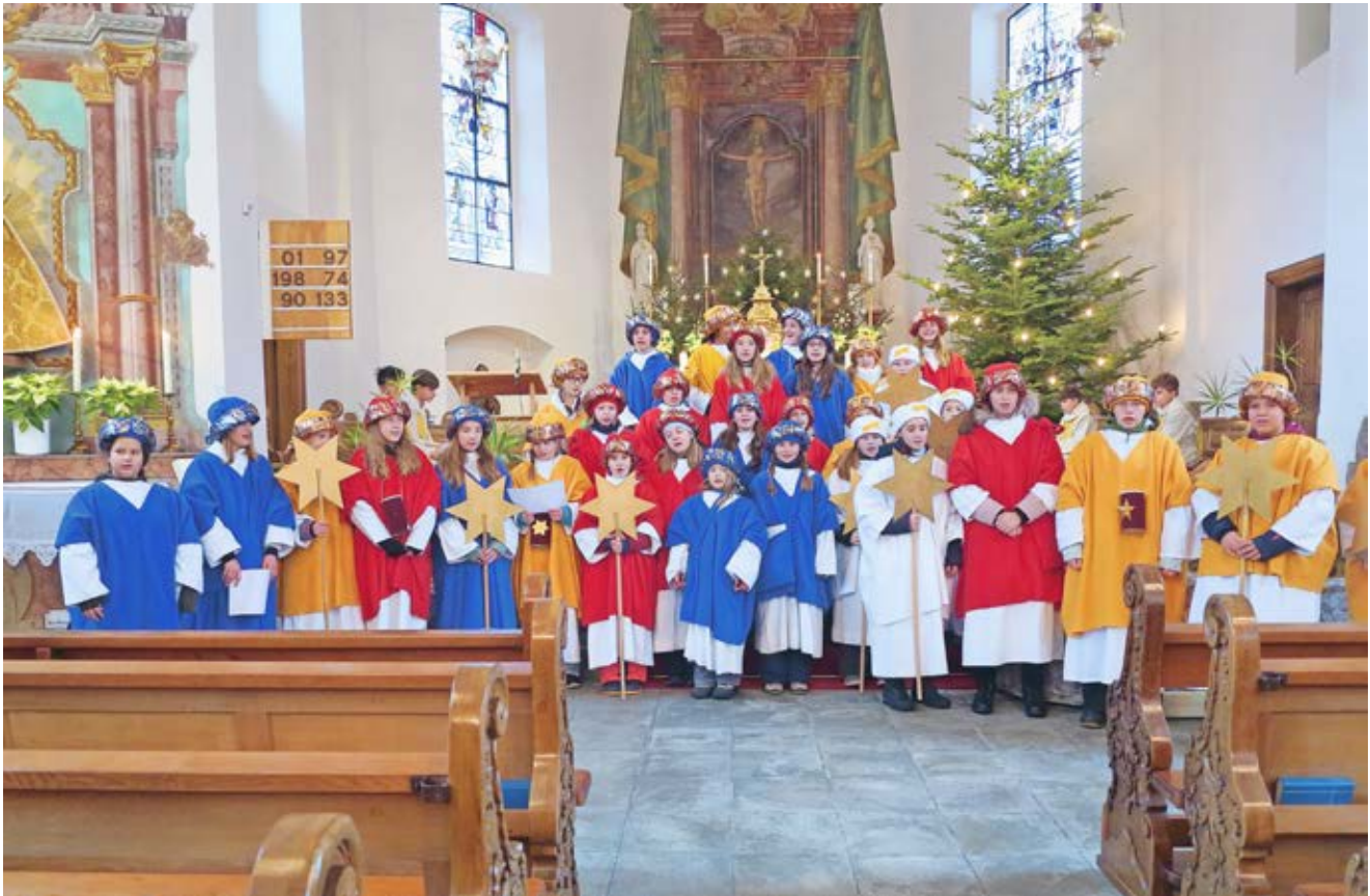
Die Sternsinger bringen jedes Jahr den Segen in die Häuser von Vilters und baten um eine Gabe für das Sternsingerprojekt gegen Kinderarbeit in Bangladesch.