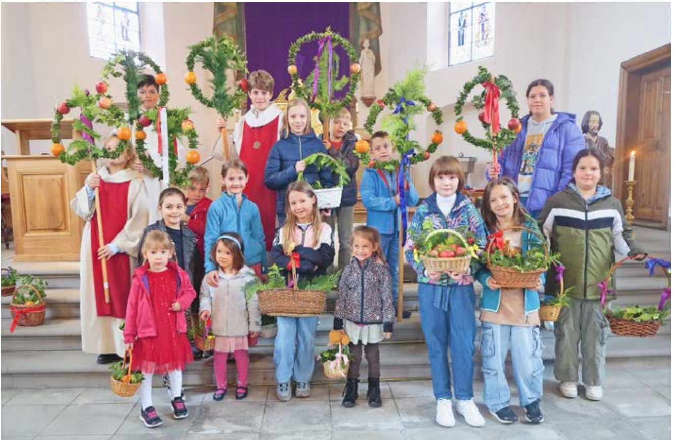
Palmsonntag: In Vilters gibt es die schöne Tradition der Palmweihe bei der St. Annakapelle. Anschließend tragen die Buben die Palmgestecke und die Mädchen Körbchen mit Palmzweigen in einer Prozession zur Kirche, musikalisch umrahmt von der Musikgesellschaft Vilters