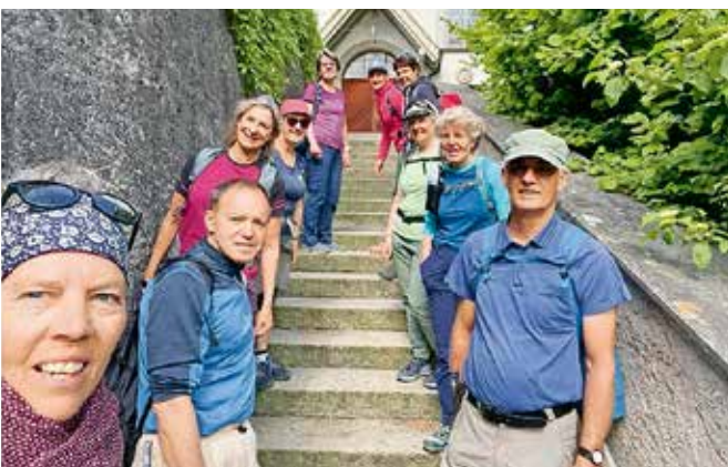
Pilgertag SE MSL