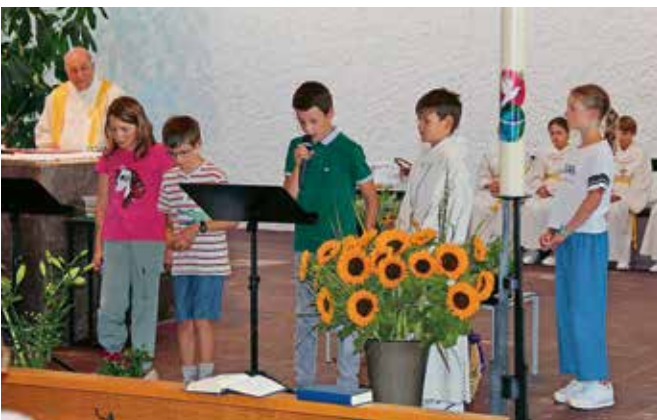
Familiengottesdienst Maria Himmelfahrt