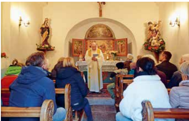
Kapellfest, St. Martin