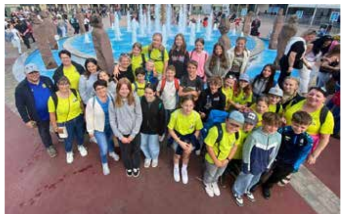
Ministranten Heiligkreuz im Europapark