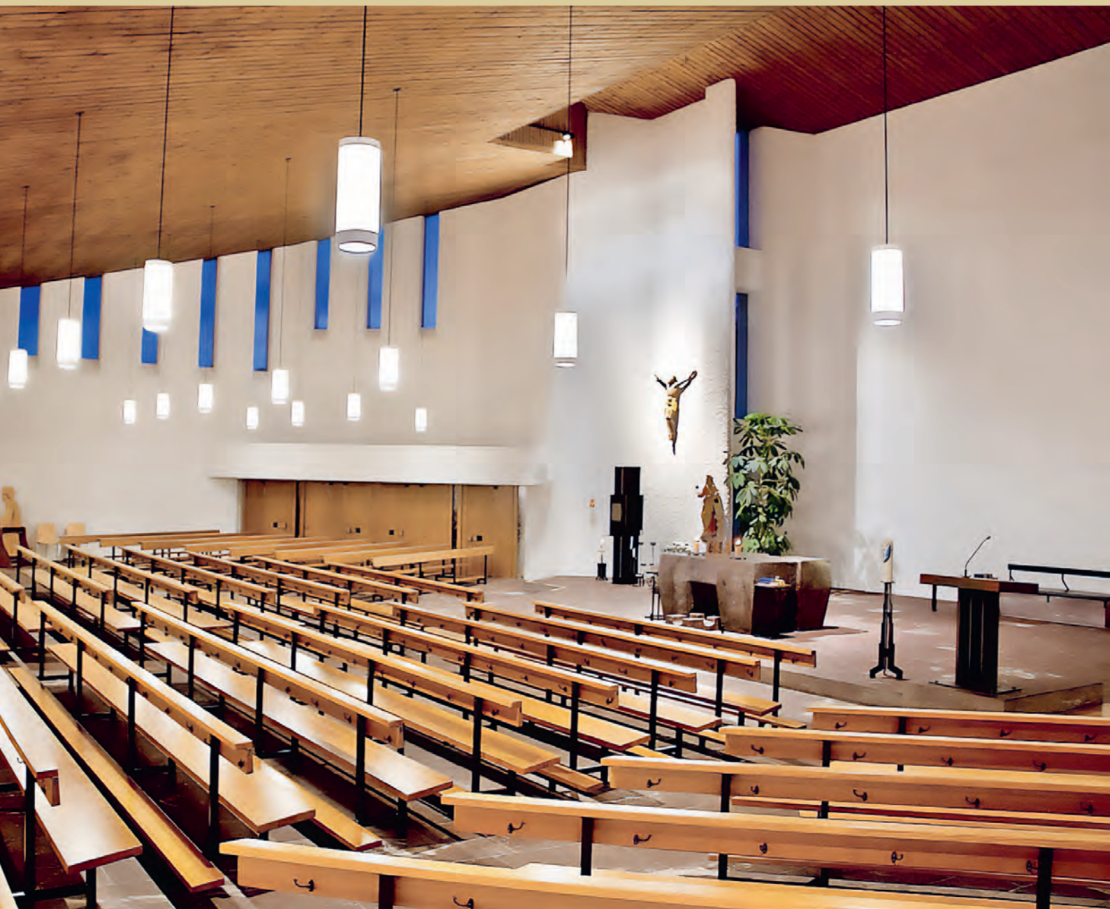
Pfarrkirche Heiligkreuz mit erneuerter Innenbeleuchtung

Ordentliche Kirchbürgerversammlung Mittwoch, 10. April 2024, 19.30 Uhr, im Pfarreiheim Mels