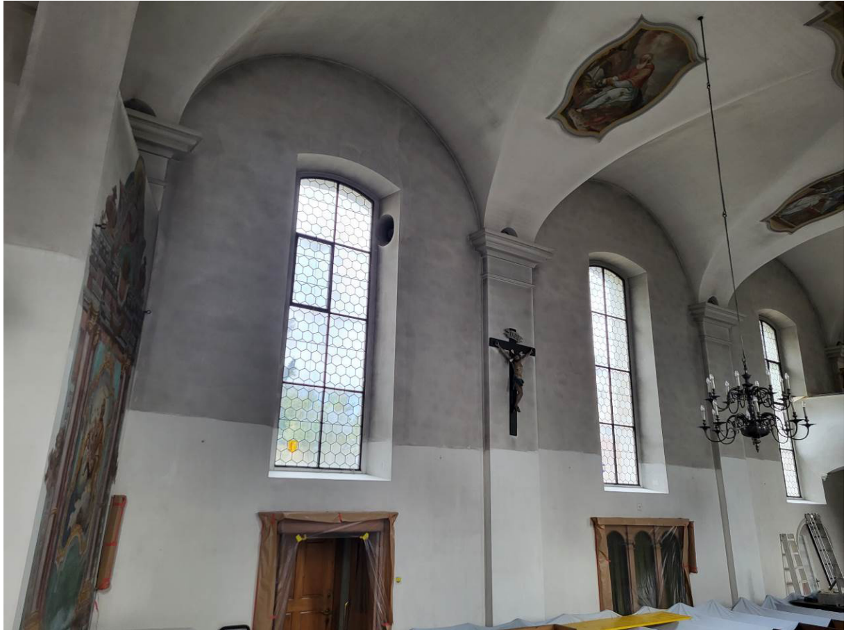
Kircheninnenreinigung im Januar - gut sichtbar der "vorher-nachher"-Effekt