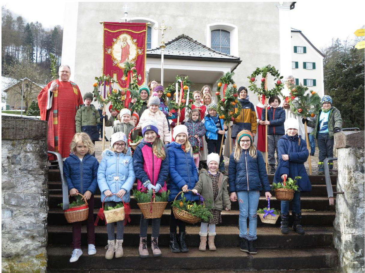
Am Palmsonntag ist es Tradition, dass die Buben Gestecke aus Palmen und die Mädchen mit Körben gefüllt mit Palmzweigen und Früchten in die Kirche einziehen.