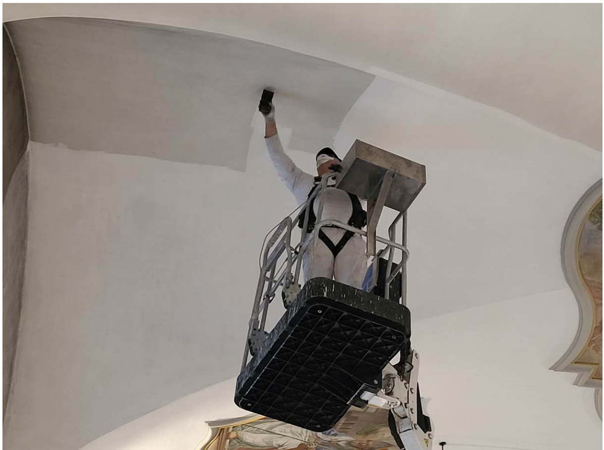
Mitarbeiter von Fontana & Fontana bei der Reinigung der Decke