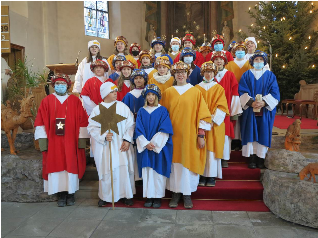
Am 08.01.2023 brachten die Sternsinger/innen den Segen in die Häuser von Vilters und baten um eine Gabe für das Sternsingerprojekt.